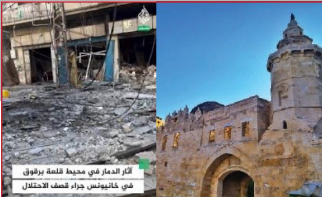
آثار الدمار في محيط قلعة برقوق في خان يونس جراء قصف الاحتلال

طال القصف الإسرائيلي بعض الأجزاء من القلعة الواقعة في قلب مدينة خان يونس. بنيت القلعة عام ١٣٨٧ م في عهد السلطان برقوق أحد سلاطين العصر العربي الإسلامي المملوكي ومؤسس دولة المماليك البرجية. المركز يتوسط الطريق بين دمشق والقاهرة حتى يرتاح فيه المسافرون اتقاءً من شر اللصوص وقطاع الطرق. وأعطت القلعة لمدينة خان يونس اسمها. فالخان هو القلعة ويونس هو الأمير يونس الداودار الذي كلفه برقوق ببنائها. وتتألف القلعة من طابقين ومسجد للصلاة. وعلى مر العصور تهدمت أجزاء من الخان وبقيت الواجهة الأمامية منه.