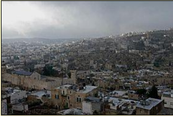
الخليل مسقط رأس التميمي

ولد في الخليل سنة ١٨٢٤م ، موطن أجداده ، وسافر وهو صغير السن مع والده إلى مصر في الثلاثينات من القرن التاسع عشر . درس على والده وكثيرين من علماء الأزهر في ذلك العهد ، وجعل اهتمامه في الأدب والشعر . سافر إلى الأستانة مع والده ، وتعرف فيها إلى كبار العلماء والأدباء . كما تعرف في مصر إلى أفضل الرجال ، ومنهم الأديب والخطيب الثوري عبد الله النديم ، وكتب شعرا في مدحه . أما أهم أعماله الأدبية فهي رواية " الدر النظيم في قصة أم حكيم ، التي طبعت في القاهرة سنة ١٨٨٨م ، وهو يعد رائد الرواية الفلسطينية . وله أيضا ديوان شعر بعنوان ديوان الصفا . توفي ودفن في القاهرة سنة ١٩٢٤م .