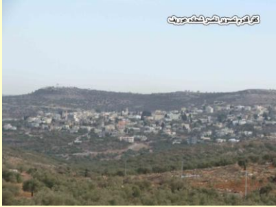
قريه كفر قدوم