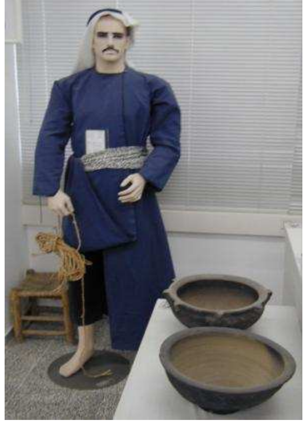
لباس مزارع فلسطيني