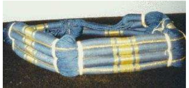
عقال أزرق وأصفر