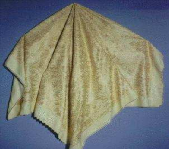
حطة مطرزة بخيط ناعم