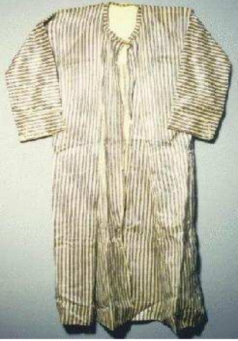
القنباز او الدماية او الهندية او الكبر لباس الرجال الفلاحين الفلسطينيين