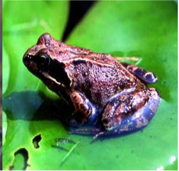
العلاجوم الأخضر الأوروبي Bufo viridis