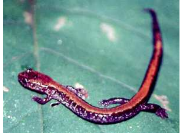
سلمندر من نوع Triturus vittatus vittatatus