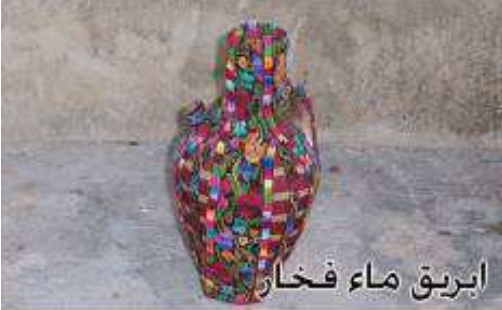
ابريق ماء فخا