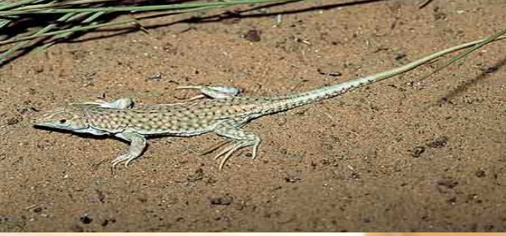
سقتقر الرمل الكبير Nidua Lizard / Acanthodactylus scutellatus