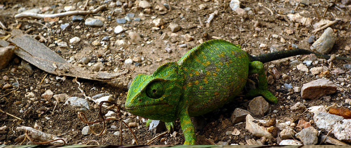
الحرباء الحرباء الشائعة / حرباء البحر المتوسط Common Chameleon / Chamaeleo chamaeleon

PO Box 816, Lakemba, NSW, 2195 Australia