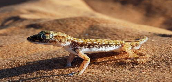
البرص حاد الذيل / دقيق الاصابع Rough-tailed Gecko / Cyrtopodion scabrum