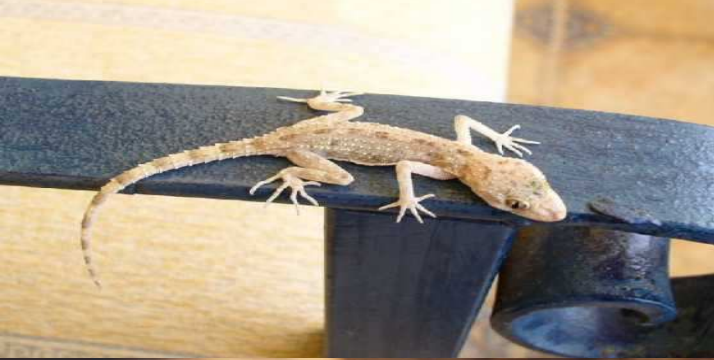
برص الرمال المصري / برص الكتبان الرملية dune gecko / Stenodactylus petrii