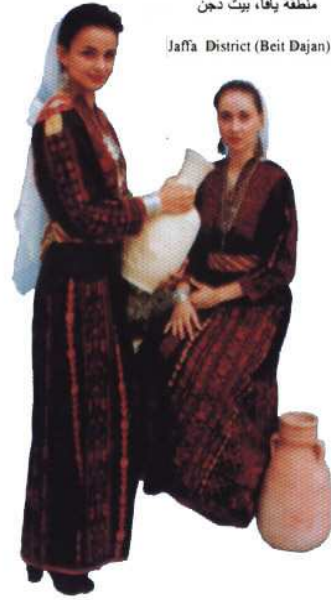
Jaffa District (Beit Dajan)