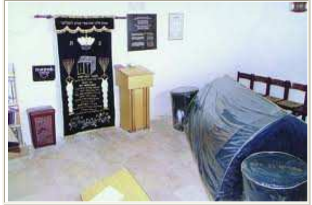
المقام من الداخل بعد الترميم

ولفت كلبونة إلى أنه وفي أواخر العهد التركي العثماني تم إغلاق هذه القبة وبناء سور حولها، وفي عام 1927 تم إضافة غرف إليه لاستعماله كمدرسة لأهالي المنطقة وكان له حارس بصفته أحد الأوقاف التي تديره دائرة الأوقاف الإسلامية في نابلس.