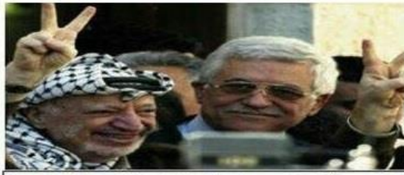
حركة التحرير الوطني الفلسطيني - فتح إقليم استراليا