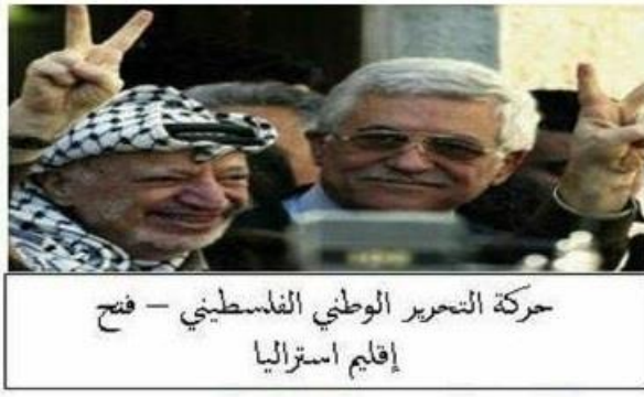
حركة التحرير الوطني الفلسطيني - فتح إقليم استراليا