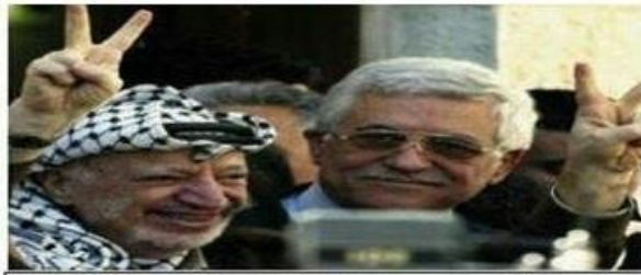
حركة التحرير الوطني الفلسطيني - فتح إقليم استراليا